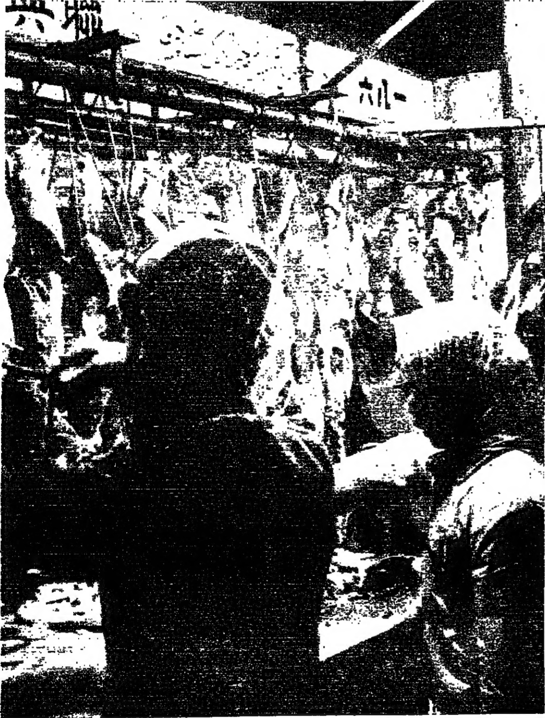
أحد محلات بيع اللحوم للمسلمين في هونغ كونغ حيث تبيع الخرافات المعزولة حسب الطريقة الشرعية .